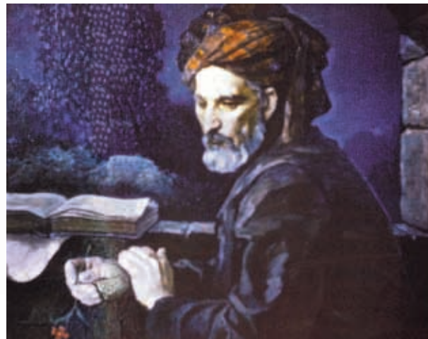
Гатран Тебризи. Художник О.Садыгзаде. 1970 г.