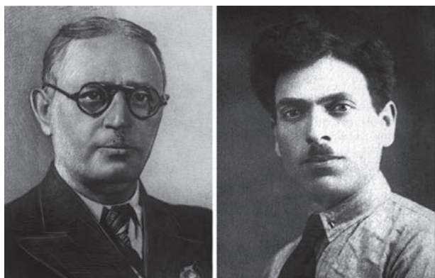
Авторы Национального Марша (Гимна) Азербайджанской Республики Узеир Гаджибеков и Ахмед Джавад

получив известность как «поэт независимости». В знаменитом стихотворении «Азербайджан, Азербайджан!» поэт от души приветствовал провозглашение АДР, а в стихотворении «Стяг Азербайджана» очень образно воспевал трёхцветный флаг республики. В период существования АДР Ахмед Джавад продолжал педагогическую деятельность, проводил культурно-просветительскую работу, помогая министру народного просвещения, вероисповеданий и финансов, председателю Совета министров АДР (14.03.1919 – 30.04.1920) Насиб беку Юсифбейли (1881–1920), принял активное участие в создании Азербайджанского государственного университета (1919). Известно, что этот период его общественной и литературной деятельности был тесно связан с лидером партии «Мусават» Мамедом Эмином Расулзаде (1884–1955), по предложению которого он в 1918 году и вступил в ряды партии.