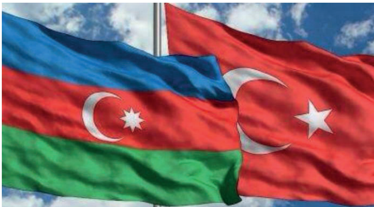
Песня "Бушевало Черное море...", автором слов которой был А.Джавад, стало гимном дружбы азербайджанского и турецкого народов

The article briefly describes the biography and activities of the outstanding Azerbaijani poet, public and political figure of the early 20th century, Ahmad Javad.