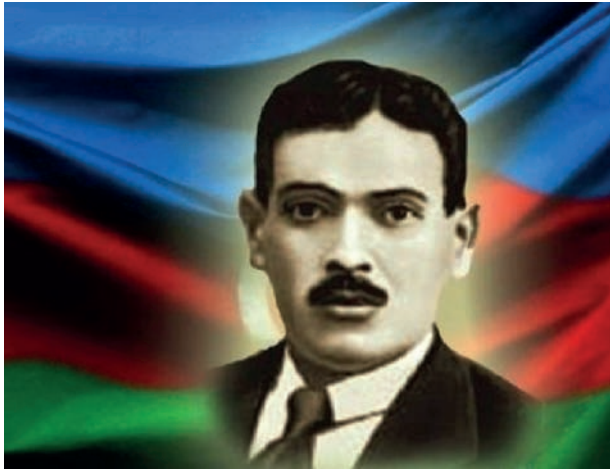
Ахмед Джавад за свою деятельность в 1918-1920 годах получил прозвище "Плашатай независимости" ("İstiqlal qarçısı")