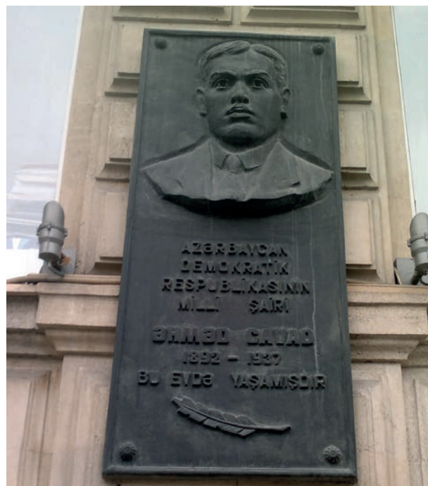
Мемориальная доска на доме в Баку, в котором жил А. Джавад